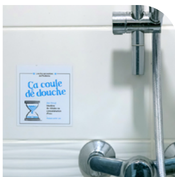
Les Écoproverbes de l'Ardèche