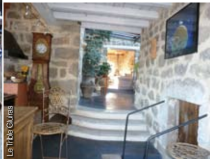
Le Tribble Gluiras