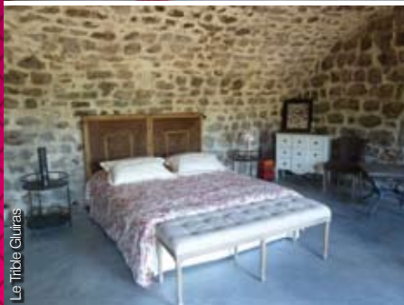
Le Tribble Gluiras