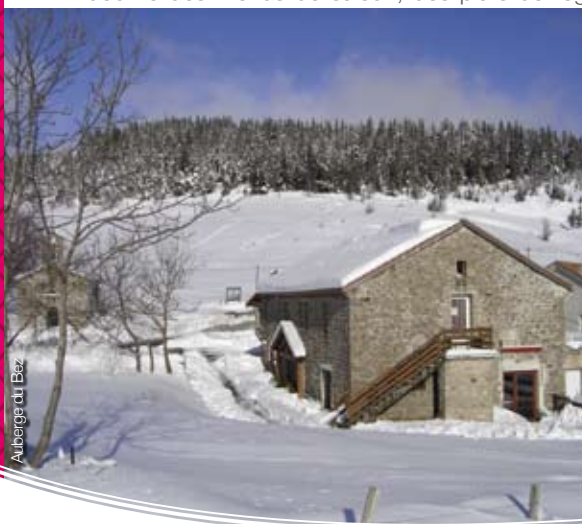
Auberge du Bez