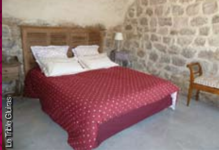
Le Tribble Gluiras