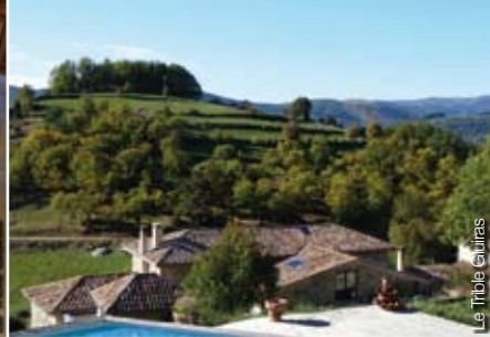
Le Tribble Gluiras