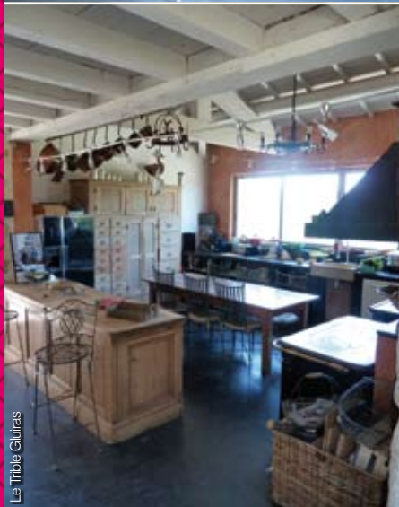
Le Tribble Gluiras