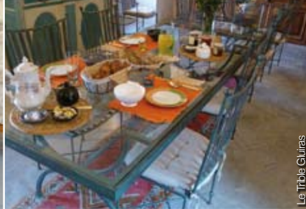
Le Tribble Gluiras