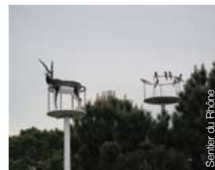
Sentier du Rhône

Contact : Sentier du Rhône – Mairie de Le Teil Rue de l'Hôtel de Ville 07400 Le Teil Tél. : 04 75 49 63 28 www.myspace.com/sentierdurhone