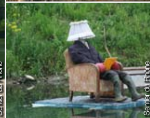
Sentier du Rhône