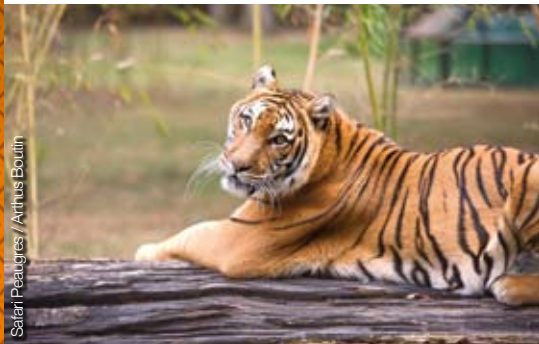
Safari Peaugres / Artius Boutin

Gitaki : les gîtes à qui ? 5000 m 2 consacrés à la biodiversité d'Europe... Une aire d'activité originale mêlant savoir et récréation ! Ecureuils, renards et castors livreront leurs secrets. L'espace Gitaki est un extraordinaire théâtre de vie niché au cœur de la biodiversité, un trait d'union entre les secrets de la nature et ceux des animaux.