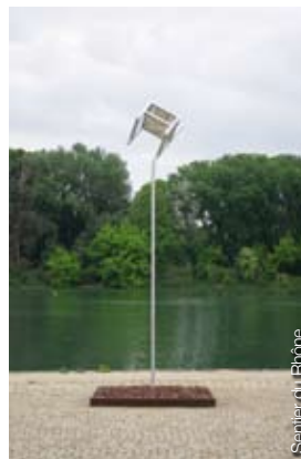
Sentier du Rhône