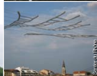
Sentier du Rhône